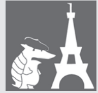
Les stéréotypes français sur l'Amérique

(des jeunes de 14-15 ans dans la ville d'Orléans)