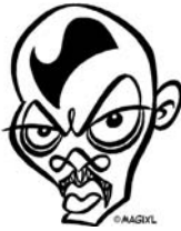
Samuel L. Jackson