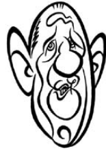
Charles De Gaulle