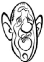
Charles de Gaulle

Choisissez l'adjectif convenable pour chaque personnage.