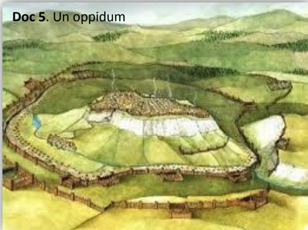
Doc 5. Un oppidum