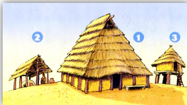
Doc 4. Reconstitution d'un habitat celtique :